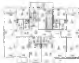
ТЕХНИЧЕСКИЙ ПЛАН ПОМЕЩЕНИЯ План этажа 4 этаж